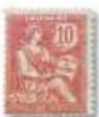
1902 Droits de l'Homme