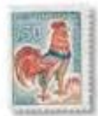
1962 Coq Decaris