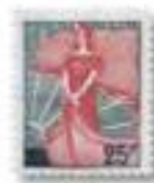
1959 Marianne à la Noë