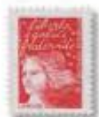
1997 Marianne du 14 juillet Luquet