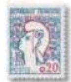
1961 Marianne Cocteau