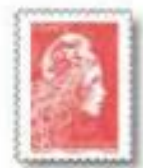
2018 Marianne l'engagée Yseult Digan