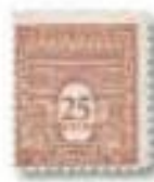
1944 Arc de Triomphe (Washington)