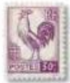
1944 Coq (Alger)