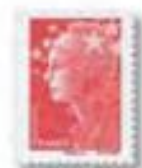
2008 Marianne et l'Europe Beaujard