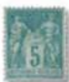
1874 Paix et commerce