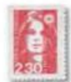
1989 Marianne du Bicentenaire Briat