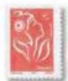
2005 Marianne des Français Lamouche